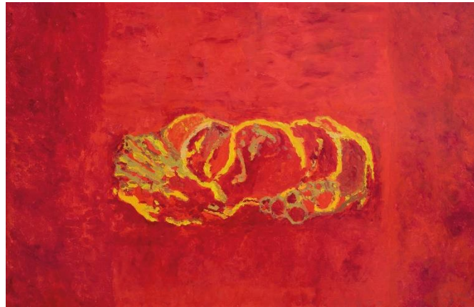
© Alberto Corazón. Gran Bodegón rojo, 2002. VEGAP, Segovia, 2022