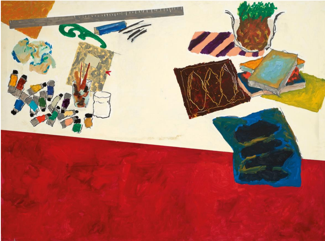
© Alberto Corazón. Mesa del artista, 2010. VEGAP, Segovia, 2022

LA EXPOSICIÓN "ALBERTO CORAZÓN. EL CAZADOR FURTIVO", ES UN TRIBUTO A LA OBRA DEL DISEÑADOR, ESCULTOR, PINTOR, POETA...PENSADOR, ALBERTO CORAZÓN.